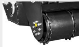
Rodillo de accionamiento hidráulico con raspador para permitir al rodillo trabajar en suelos húmedos