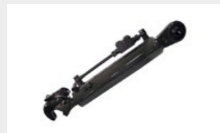
Tercer punto hidráulico para lograr y mantener la profundidad