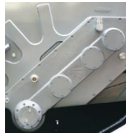
Doble transmisión lateral de engranajes para desacelerar el rotor, por ende reducir desgaste de dientes