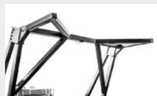
Estructura de empuje mecánica encanala el material antes de la trituración