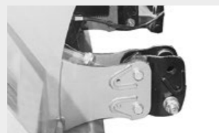
Acople de tercer punto extendido ajustable