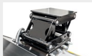
Lámina de acople con dispositivo de auto nivelación para ajustarse a todo tipo de terrenos